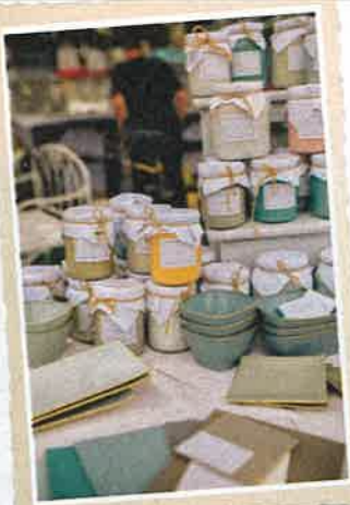
Pinturas naturales El Taller. Abajo, una de las visitantes.