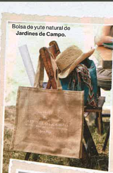
Bolsa de yute natural de Jardines de Campo.