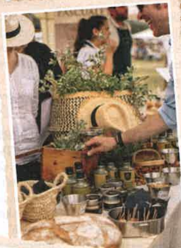
Dcha., aceites Reinos de Caravaca. Abajo, stand de Moon Caviar.