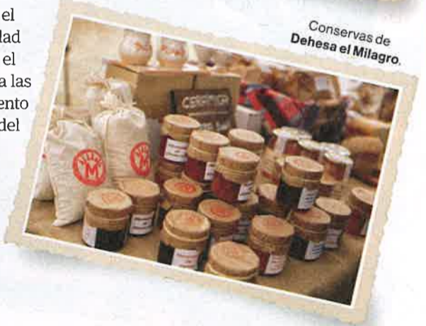
Conservas de Dehesa el Milagro.