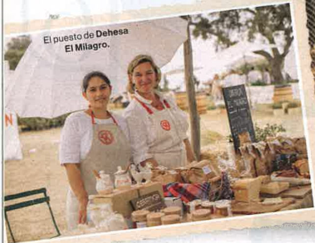
El puesto de Dehesa El Milagro.