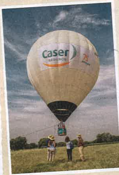
El globo de Caser Seguros.