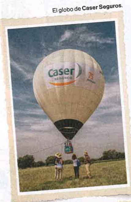
El globo de Caser Seguros.