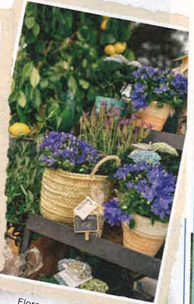
Flores de Alfabia.