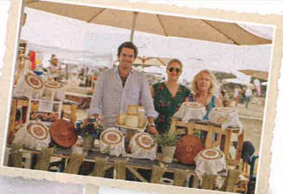
El puesto de quesos artesanos Valdivieso.