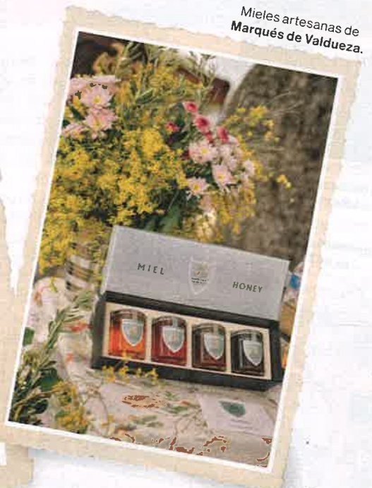
Mieles artesanas de Marqués de Valdeza.