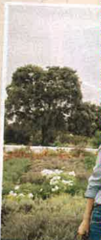
Cristina Díaz de... y diseñ...