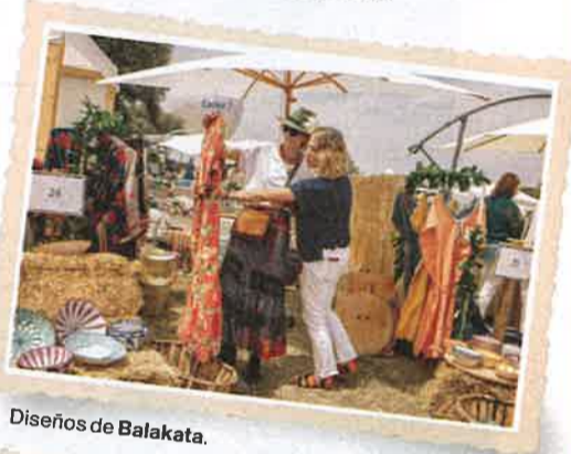
Diseños de Balakata.